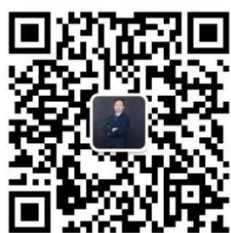
招聘负责人微信号