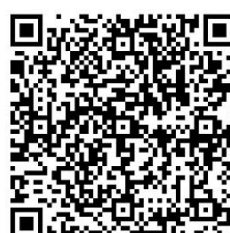
BGYFW 韶关 2022 届校招群